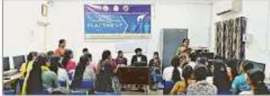
Officials conducting the placement programme at Gurukul Mahila Mahavidyalaya, Raipur.