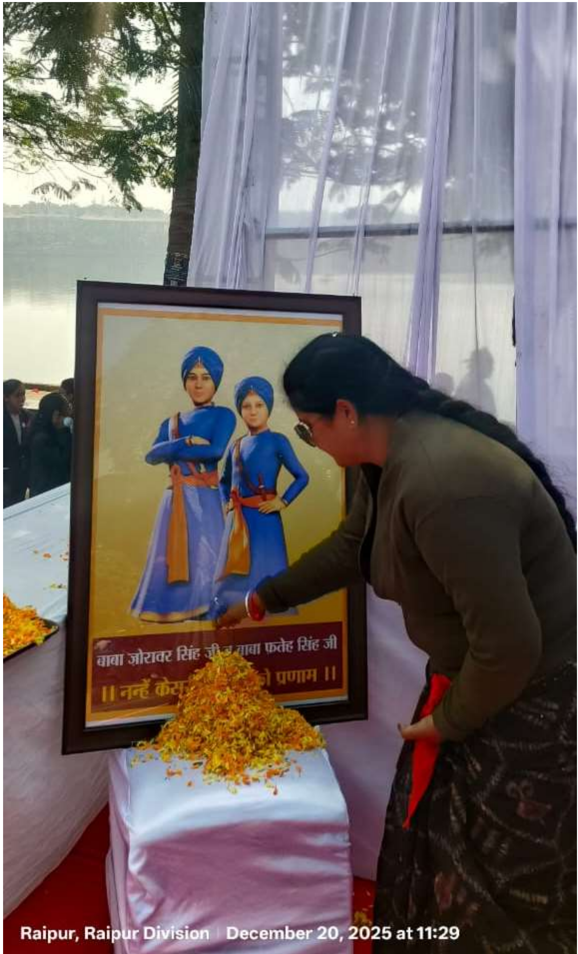
Raipur, Raipur Division | December 20, 2025 at 11:29