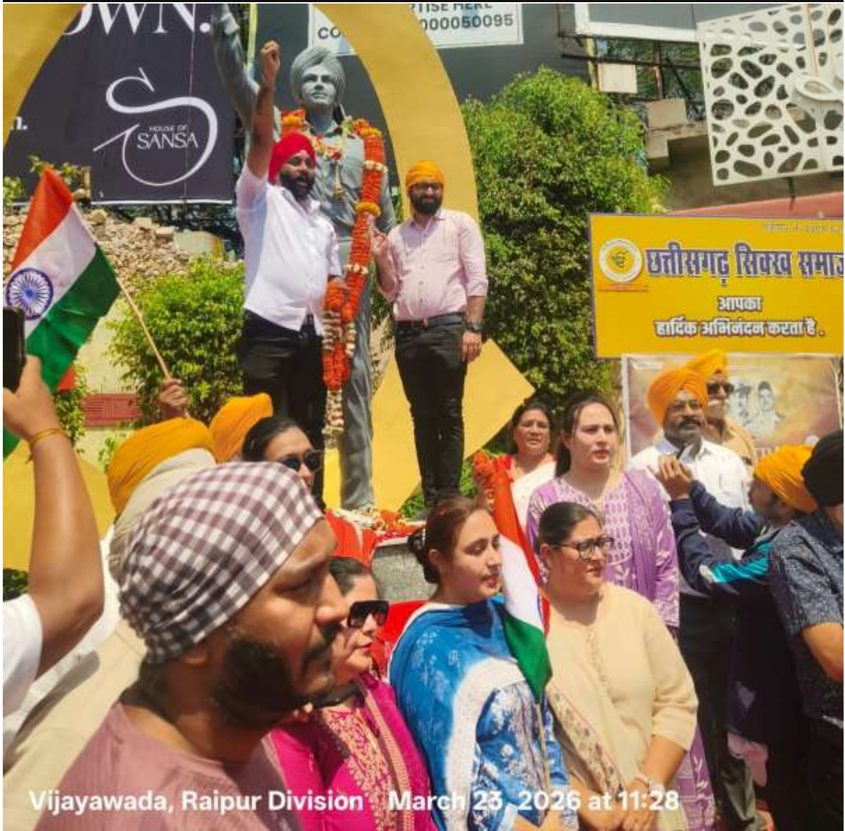
Vijayawada, Raipur Division March 23, 2026 at 11:28